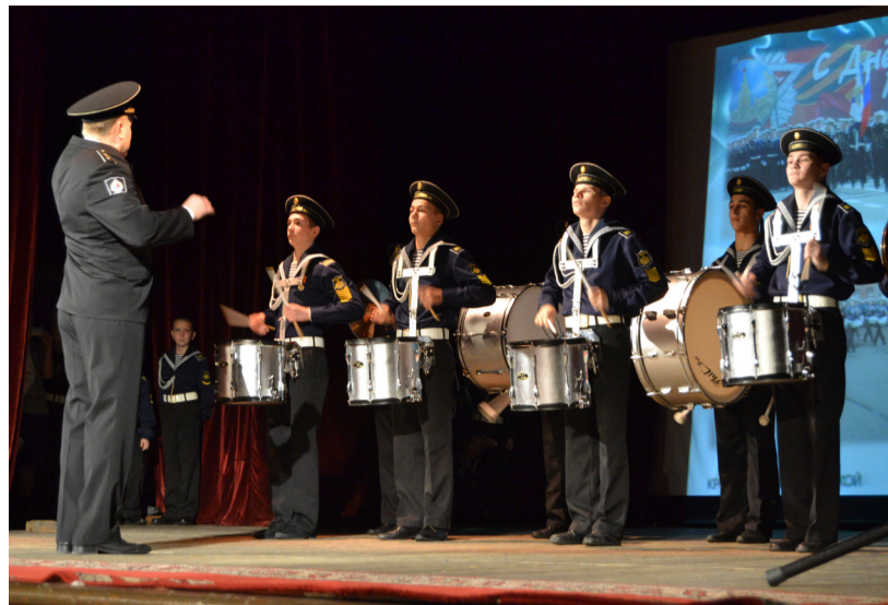
(Окончание. Начало на стр. 1)

Перед концертом прошло чествование лучших педагогов, воспитателей и сотрудников КМКК.