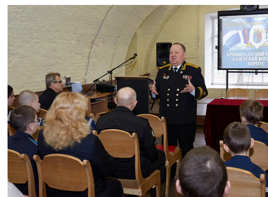
Почетный кадет Кронштадтского морского кадетского военного корпуса контр-адмирал Спешилов А. В. приветствует собравшихся участников и гостей конференции.